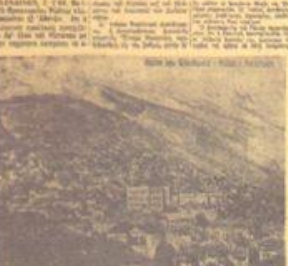
400 ΟΡΜΟΙ ΣΤΙΣ ΤΕΣ ΑΡΜΑΤΕΣ

Βαδμιαίως σαρώνεται και ή άλλη άμυντική γραμμή... (Text reports on military advances)